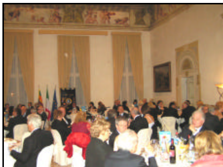
Un aspetto del salone di Villa Morosini a Polesella (RO)